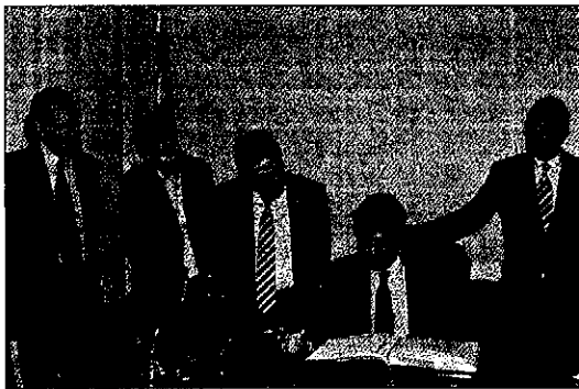
Recoder anunció novedades en su visita a Lleida la semana pasada

ller de Territori i Sostenibilitat, Lluís Recoder, la semana pasada, el Govern de la Generalitat deberá realizar una inversión de 1,5 millones de euros para que el Aeroport de Lleida-Alguaire pueda operar estos dos vuelos a la vez.