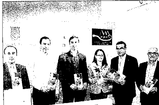
La nova entitat es va presentar ahir a la Diputació de Lleida.

gada), en què diversos restaurants oferiran menús de degustació amb productes de temporada i herbes. També col·laboraran en l'organització, el 12 de juny, de la primera Fira del Vi de Tàrraga. Més enllà de la gastronomia, l'entitat vol crear paquets turístics amb el Tren dels Llacs o el COU.