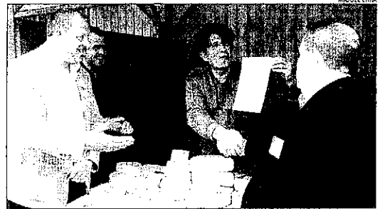
Moment de l'entrega del guardó durant la fira Lactium.