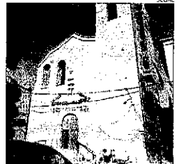
Una imatge de Soses.

11:00 Trobada a l'ermita de Sant Miquel per fer la benedicció del terme i celebració de la missa en