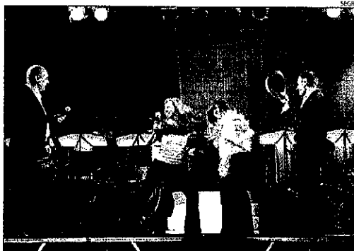
La Montgrins posarà la banda sonora dissabte.

Alguns, ben inoguts, com el cas de la setena pedalada, els partits de futbol o les sessions de ball, animades per Montgrins i Atalaià. Altres, picant l'ullet a la cultura, com l'exposició de pintura dedicada a Picasso de l'associació de dones. I uns tercers, tan emblemàtics com la trobada a l'ermita de Sant Miquel, on beneiran el terme i oficlaran una missa cantada. Per postres, tothom farà rotllana als acords de la cobla Solsona. Aquest, com la resta d'actes, són de franc.