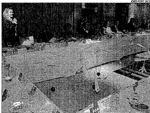
Membres de les institucions de Lleida, amb periodistes francesos.

ció de Lleida a París a través de la connexió que ofereix l'aeroport" i, igual que les empreses lleidatanes, es va mostrar convençut que "en els pròxims mesos, podem veure un increment en el nombre de turistes francesos".