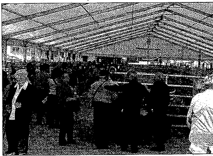
La Fira de Sant Isidre es un referente en la comarca

Un total de ocho explotaciones ganaderas de la comarca del Solsonès, productoras de ovino y caprino, se han asociado con el fin de dar a conocer su ganado, elaborado según unos exigentes criterios de producción. El objetivo es promover el consumo de cordero y cabrito de calidad de la comarca. La nueva asociación se llama Asociación de Criadores de Xal i Cabrit del Solsonès. Según han explicado los promotores de la iniciativa, que ya hace tiempo que dedican un especial cuidado a sus rebaños, la intención es poner de manifiesto que en el Solsonès se produce carne de calidad. Además, también se quiere que el público valore la diferencia. Por eso, durante la feria de Sant Isidre, se distribuirán 3.000 trozos de cordero. Durante la Fira de Sant Isidre, que tendrá lugar del 14