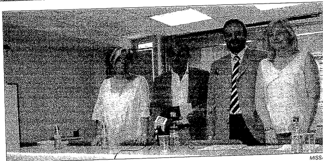
Les autoritats locals i els responsables d'Acció Social i de l'Institut de les Dones, durant la presentació.