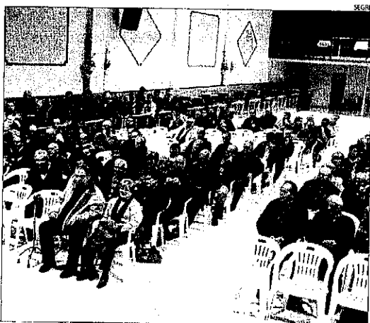
Imatge d'una de les assemblees d'afectats de Copalme.

MADRID | La Fundació de les Caixes d'Estalvis (Funcas) proposa un augment gradual de l'edat de jubilació fins als 70 anys per al manteniment futur del sistema de pensions, segons l'informe La reforma de la Seguretat Social . Funcas advoca per una reforma "profunda" de les cotitzacions a la Seguretat Social, el cost del qual podria ser compensat amb un "moderat" augment de l'IVA i defensa una pensió pública màxima amb valors que es revisin anualment amb l'IPC i el càlcul de les prestacions tenint en compte les cotitzacions de 20 o 25 anys de vida laboral.