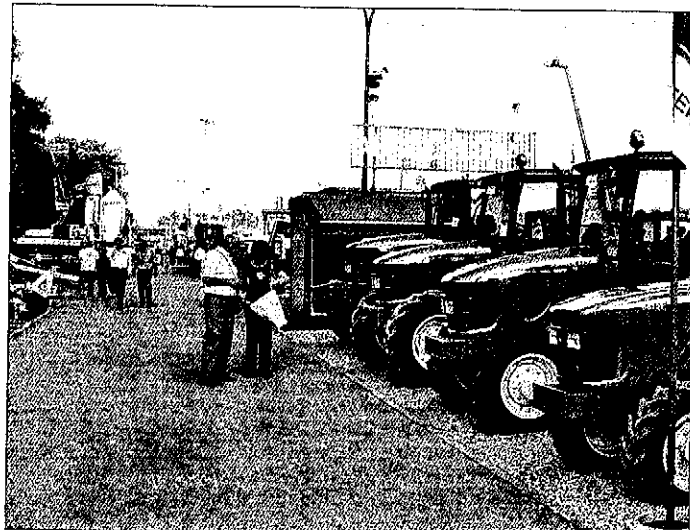
El sector de la maquinaria agrícola tiene un protagonismo especial en la feria leridana

Fira de Sant Miquel se realizará, este año, entre los días 25 y 29 de setiembre. Tras la polémica el año pasado por el estado del suelo de exposición -que este año se ha pa-