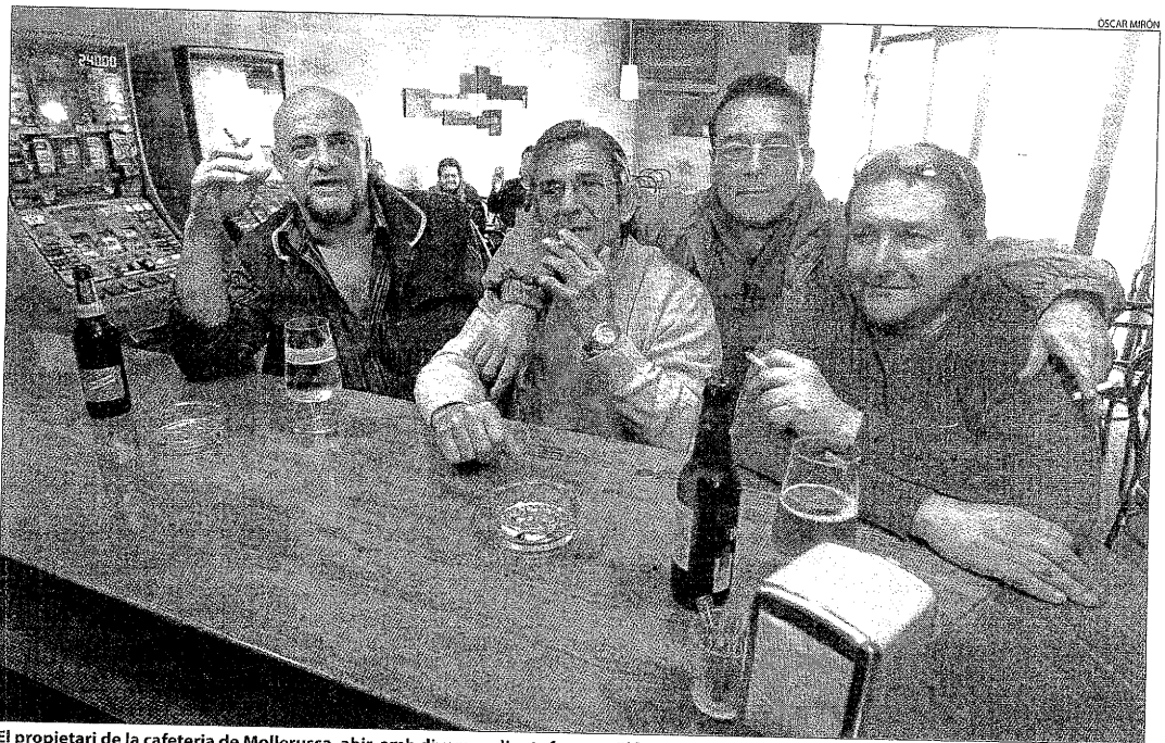
El propietari de la cafeteria de Mollerussa, ahir, amb diversos clients fumant. El bar ha triplicat la clientela des que s'hi permet fumar.