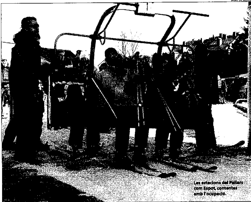
Les estacions del Pallars com Espot, començar amb l'ocupació.