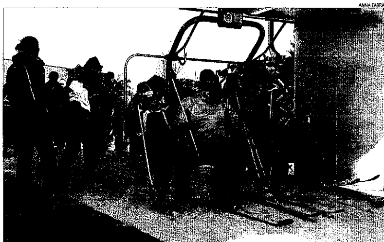
Una família puja a un telecadira de l'estació d'esquí d'Espot, al Pallars Sobirà.

Taüll i Port del Comte. Les nevades des de llavors han deixat entre 15 i 30 centímetres de neu a les estacions, cosa que ha permès obrir noves pistes i consolidar les ja obertes. També els dominis esquiabls andorrans van registrar una elevada afluència d'esquiadors, acompanyada d'una ocupació hotelera que frega el ple al Principat. La situació és similar a l'estació de Cerler, a Osca.