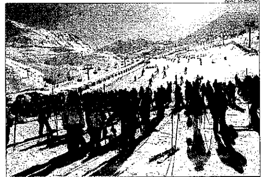
BoiTall i va rebre ahir uns 4.500 esquiadors.

OCUPACIÓ DEL 95% A LES COMARQUES DE MUNTANYA