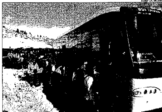
Cues per accedir als autocars a l'estació d'esquí de BoiTall.