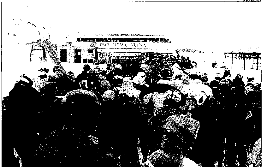
Una llarga cua per accedir a un dels telecadres de Baqueira, que ahir va rebre uns 14.000 visitants.

Diverses estacions de Lleida van coincidir a afirmar que l'afluència d'esquiadors des de l'inici de la campanya de Nadal supera la de l'any passat, tot i que persisteix la crisi econòmica. Les nevades dels últims dies han permès als complexos lleidatans millorar l'estat de les pistes respecte a la setmana anterior, quan pluges i temperatures suaus van arribar a rebaixar els gruixos de neu acumulats. La gran majoria de les pistes i remuntadors de les estacions lleidatanes estaven ahir oberts al públic.