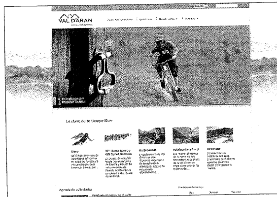
Una de las webs que permiten conocer el Aran a través de la red

Las webs del valle reciben 250.000 visitas entre agosto y diciembre