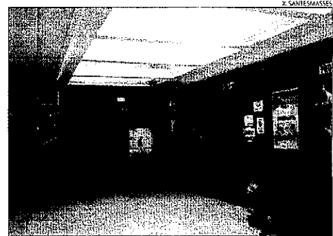
Es reformarà l'acústica i la climatització de les sales.