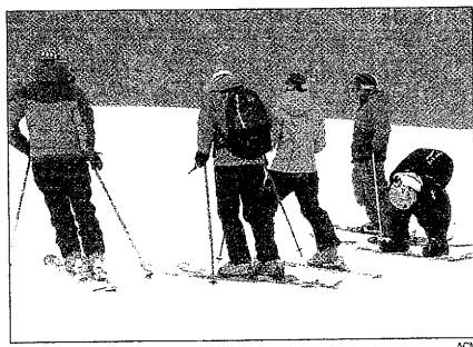
Espot recibió ayer a sus primeros esquiadores del año

de nieve a lo largo de toda la temporada a la estación, que tiene innivados el 63% de sus pistas después de la colocación de 36 nuevos cañones de un total de 126.