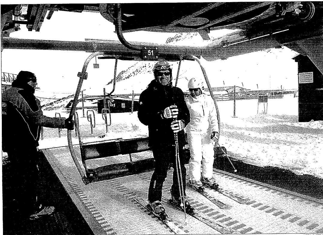
La estación ribagorçana de Boí Taüll abrió ayer sus puertas y espera la llegada de cientos de esquiadores por este puente de la Purísima