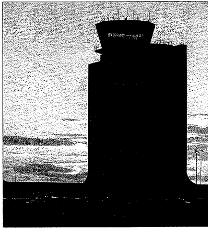
El aeropuerto de Alguaire todavía carece de frontera