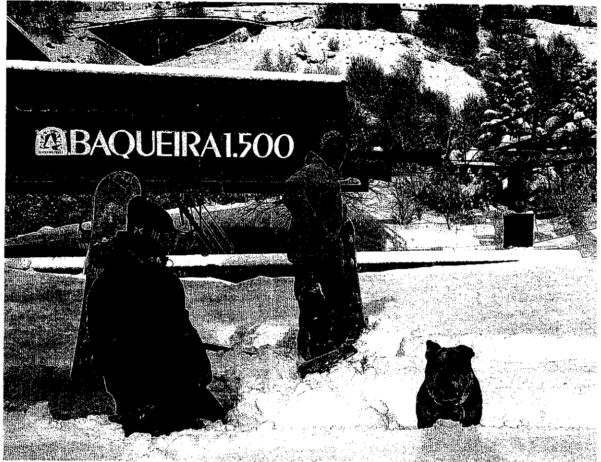
Nieve asegurada. Las estaciones de esquí como Baqueira dan los últimos retoques para abrir el puente, y reciben como oro blanco la nieve que cae a última hora y que permite mejorar las condiciones para los esquiadores

■ El pausado ritmo de reservas para el puente de la Constitución contrasta con las buenas previsiones que la mayoría de los complejos cercanos a las estaciones de esquí tienen para las fiestas de Navidad. Hoy por hoy, muchos hoteles tienen ya reservadas más del 80% de sus plazas para la semana del 26 de diciembre y los primeros días de enero. Si el ritmo de reservas continúa como ahora, en pocos días buena parte de esos complejos podrían colgar el cartel de completo. Estos clientes han elegido destino sin preocuparse si habrá o no nieve en las pistas esas fechas. El lleno de los hoteles para la Navidad suele coincidir con la plena ocupación de la mayoría de segundas residencias cerca de las pistas. Una circunstancia que nada tiene que ver con lo que ocurre con el puente de la Constitución, cuando el turista aguarda a confirmar su reserva cuando tiene garantizada la nieve suficiente para poder practicar ese deporte. Si eso no ocurre, ese cliente suele buscar otro destino.