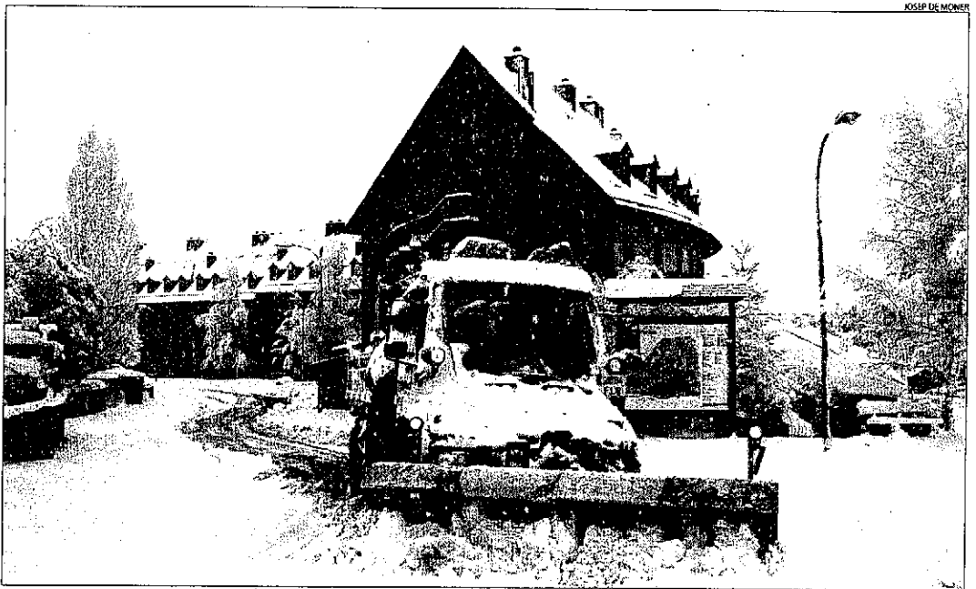
Una màquina llavaneu obrint pas a la zona del Pla de l'Ermita, a la vall de Boí.

Fonts de Boí Taüll Resort van destacar que "hi ha possibilitats d'obrir el cap de setmana que ve". La nevada d'ahir va deixar al complex uns 30 centímetres de gruix, que preveuen augmentar amb la fabricació de neu artificial. En la mateixa situació estan els dos complexos del Pallars Sobirà, Espot Esquí i Port Ainé, on es van acumular entre 15 i 20 centímetres de neu. "Fins a mitja setmana no podem confirmar l'obertura de l'estació. És important que les temperatures es mantinguin baixes per fer funcionar els canons", van assenyalar fonts de Gran Pallars. També preveuen obrir per la Puríssima a l'estació de Port del Comte, on ahir van caure uns 15 centímetres de