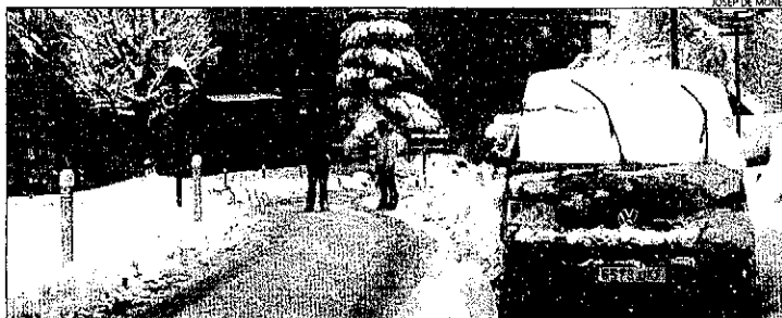
L'Alta Ribagorça (a la foto), el Pallars Sobirà i Aran van registrar les nevades més importants.

Obliga a usar cadenes a la Bonaigua i provoca restriccions al túnel de Vielha