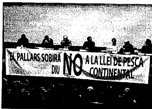
L'acte de protesta celebrat ahir a la nit a Sort.

Un portaveu dels pescadors va subratllar que la protesta pretén "freinar" l'aprovació de la nova llei per reobrir el diàleg amb els implicats. La mateixa font va criticar les limitacions que estableix el text a activitats com la pesca amb captura. El president del consell del Pallars Sobirà, Xavier Ribera,