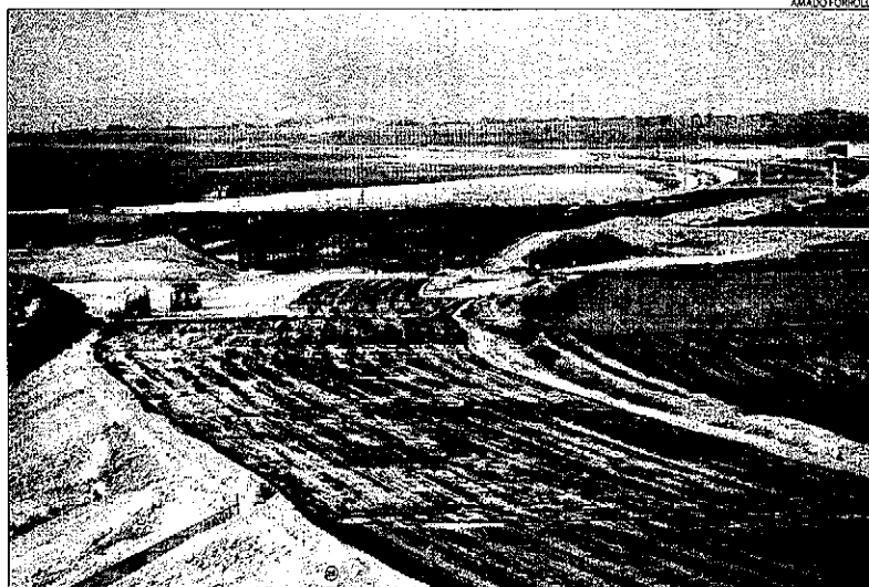
El traçat de la A-14 entre Rosselló i Almenar, que discorre prop de l'aeroport, avança a bon ritme.