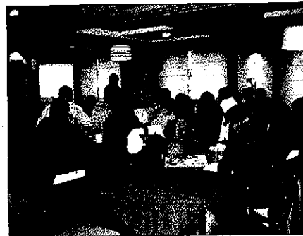
La charla se realizó en el hotel Acevi de Vielha