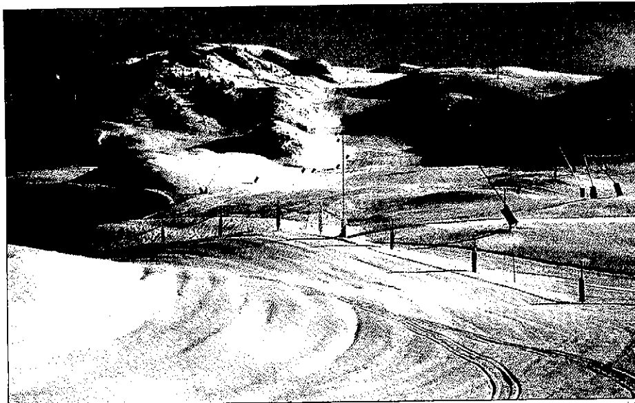
Las cotas altas de la estación de esquí aranesa acumulaban ayer cerca de 70 centímetros de nieve