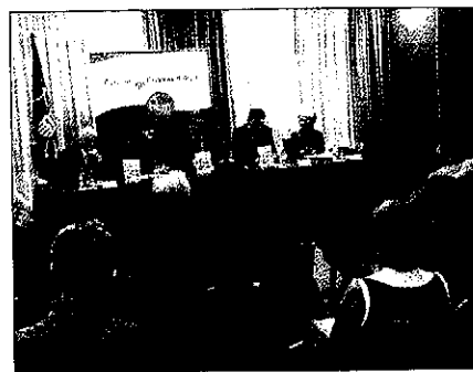
Una cincuentena de personas asistió a la conferencia

El objetivo de Baqueira Beret para la temporada de invierno que inicia mañana es similar al del resto de estaciones de esquí catalanas: que el número de esquiadores sea similar al de la temporada pasada. El invierno pasado, en plena crisis económica, la estación logró un número satisfactorio de esquiadores gracias a la abundante nieve caída.