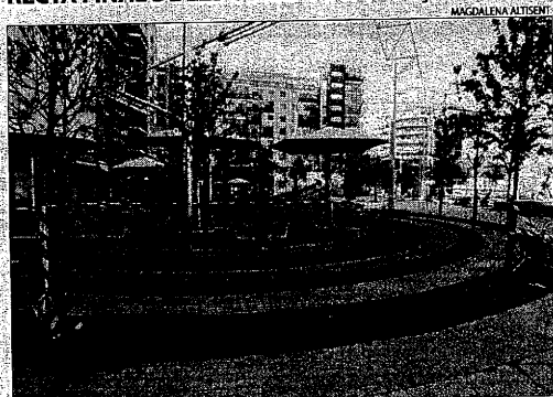
La part central de la plaça ja està oberta al públic i només queden pendents els acabats dels dos accessos al pàrquing.