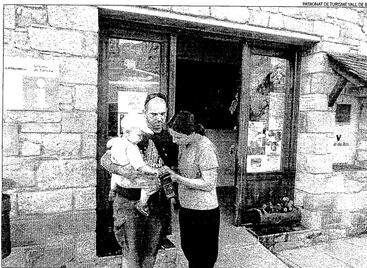
Turistes consultant la informació sobre la ruta, a les portes d'una oficina de la Vall de Boí.

Les referències sobre els punts d'interès estan en quatre idiomes i combinen text, imatge i àudio