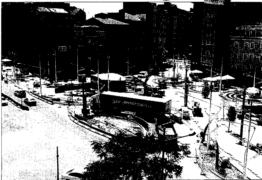
SALVADOR MIRET (ACN)

► La esperada rotonda de la plaza Ricard Viñes se abrirá al tráfico este sábado