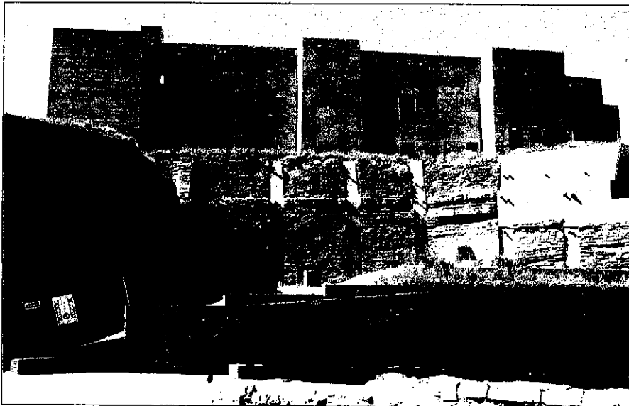
Las obras de los accesos culminan un proyecto de restauración de la Suda para albergar el Centre d'Interpretació