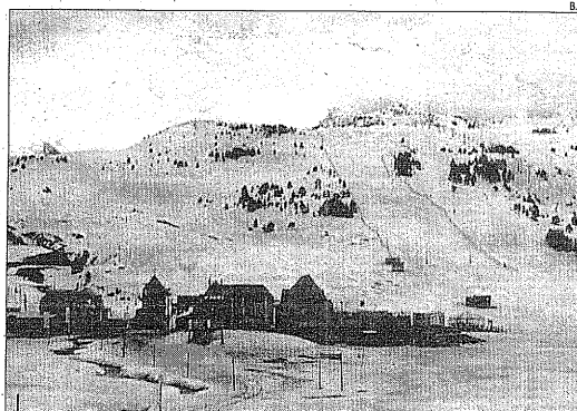
Les pistes de Beret, a la Val d'Aran, durant la jornada d'ahir.