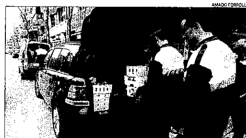
La Urbana, en el moment de decomissar el menjar.