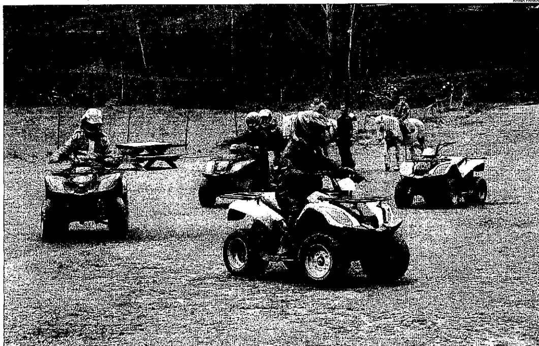
Turistes en quads i a cavall a Rialp. El fred va decantar la balança cap a les activitats de terra en detriment de les aquàtiques.

El sector, satisfet al complir-se les previsions d'ocupació per a aquest pont