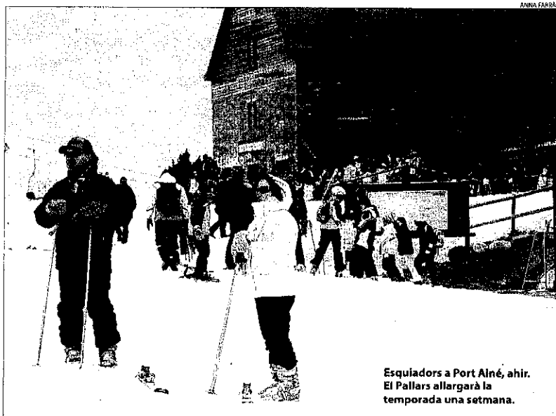
Esquiadors a Port Ainé, ahir. El Pallars allargarà la temporada una setmana.