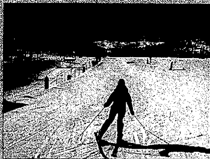
La mayoría de estaciones han cerrado

Por otra parte, las estaciones vecinas de Fontfau y Cerdà aguantarán una semana más antes de del por-